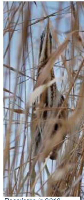
Roerdomp in 2010 helofytenfilter Kandelaarweg