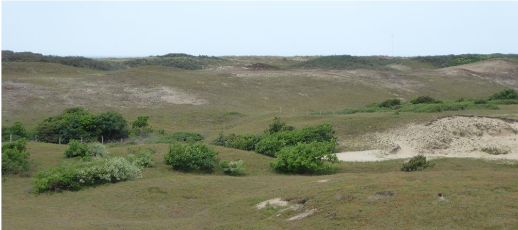
Bomen geschoren door de zoute wind