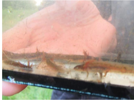
Juvenile kleine watersalamanders