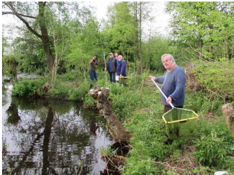
Eendenkooi, grote vijver

marm grondel. Als bijvangst hadden we ook 4 kleine watersalamanders. Bij elkaar toch weer 6 soorten.