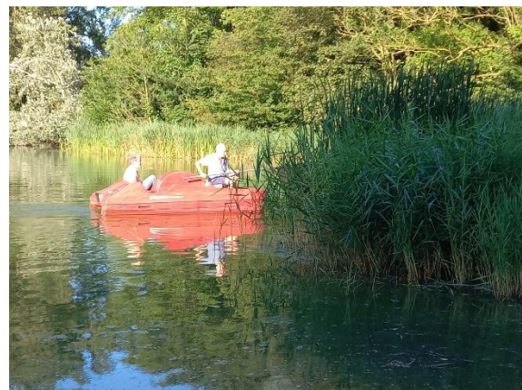
Geert en Jos met trapboot