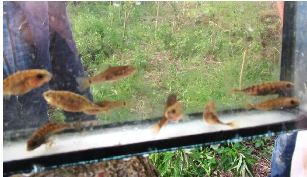
tiendoornige stekelbaarzen en zeelten