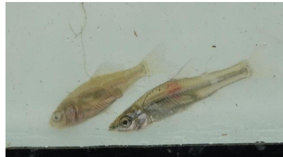
Giebel en blauwband (exoot)