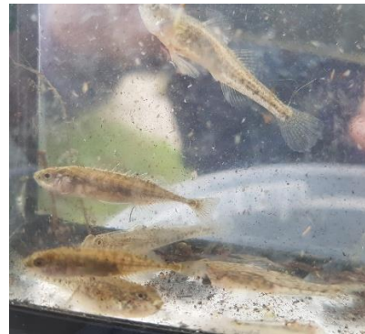
Kaukasische dwerggrondels en tiendoornige stekelbaars