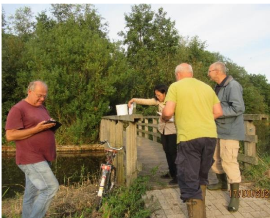
Team vissen + gast

Dinsdagavond zijn we met onze schepnetten gaan vissen in de wateren die aan weerszijden van het Bosdierenpad in Tanthof lopen. We waren met een groep van 5 personen en hebben de eerste schepronde aan de westzijde van het wandelpad geschept. Dit is een wat grotere waterpartij, waar gelukkig net het riet was gemaaid. Hierdoor konden we makkelijker scheppen. Alleen vingen we maar een soort op deze plek en dat waren ook nog allemaal Kaukasische dwerggrondels (exoot), wel in enorme hoeveelheden. Het waren er ca.150 stuks, wel heel klein. Minder dan 3 centimeter. Het tellen in het cuvet viel dan ook niet mee. In de tweede ronde zijn we aan de oostzijde van het Bosdierenpad gaan scheppen. Dit waren meer de sloten die tot de woningen en achtertuinen van Tanthof liepen. Dit water zag er al niet goed uit, donker en zonder veel waterplanten. We vingen hoofdzakelijk Amerikaanse rivierkreeften en een middelgrote baars. De totale vangst was dus nogal teleurstellend. Exoten, die hier niet thuishoren en veel Amerikaanse rivierkreeften. De waterkwaliteit in dit deel van Delft moet dan ook snel beter worden, als hier nog een visbestand wil overleven.