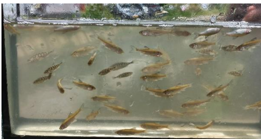
Vetjes en tiendoornige stekelbaarzen

In onze 2e schepronde zijn we achter het Gemaal aan de lage zijde gaan scheppen. Hier vingen we in veel lager aantallen ook weer driedoornige stekelbaarzen, maar ook blankvoorns, baarzen, vetjes en ook weer de exotische Kaukasische dwerggrondel. Plus natuurlijk weer Amerikaanse rivierkreeften. Qua soorten was er dus nauwelijks verschil tussen het hoge en het lage deel. Opvallend was het ontbreken van de kleine modderkruiper, die we normaal altijd in enorme aantallen in onze sloten aantreffen. Een geslaagde avond.